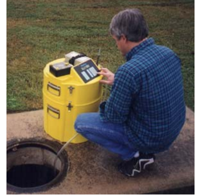
PST Manhollerde kullanıma uygundur