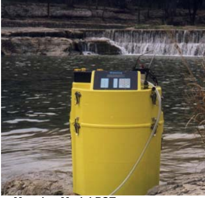
Manning Model PST